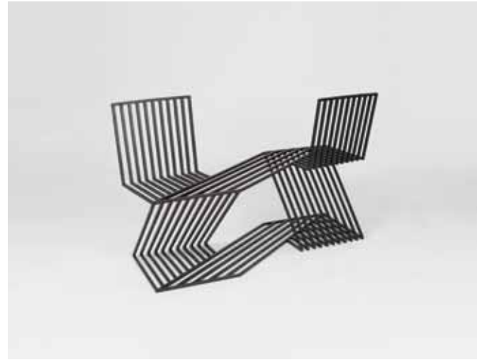
linksboven Erin Turkoglu, 'Chromatic nature'. Foto: Erin Turkoglu.