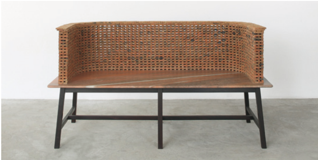
ci-contre Le BRICK STUDIES I & II par le Studio Mumbai / Bijoy Jain.